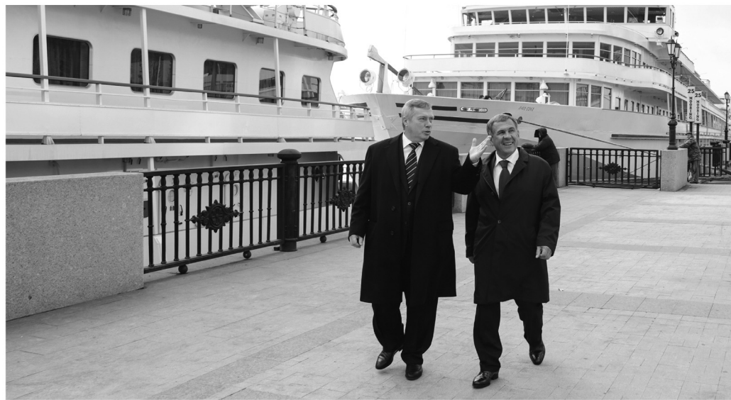
Василий Голубев показал Рустаму Минниханову реконструированную набережную

Многому Ростовская область планирует научиться у Татарстана и в деле организации масштабных массовых событий – у нас практически на носу футбольный чемпионат, а Казань только что блестяще провела Универсиаду.